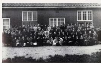
De boerinnenbond met veel bekende gezichten.