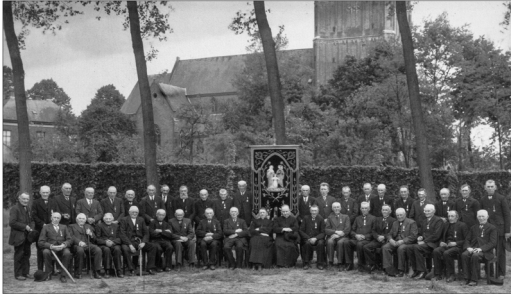
De Heilige Familie achter het parochiehuis

gele kruis hield er haar spreekuur en b.v. de jongenboerenstand, het mannenkoor en andere verenigingen konden er terecht voor hun activiteiten.