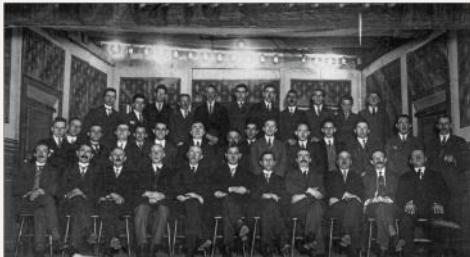
Het mannenkoor op het podium van het Patronaat