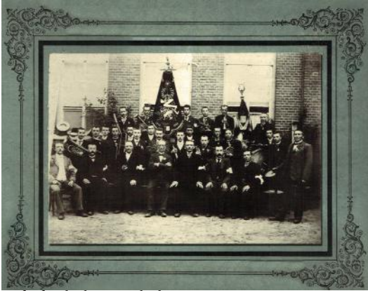
De fanfare bij het parochiehuis.