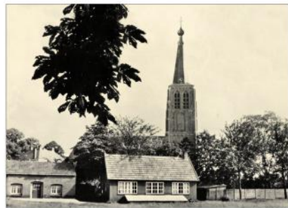
De gebouwen van KMG en Jong Nederland